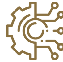
Электротехника и электроника