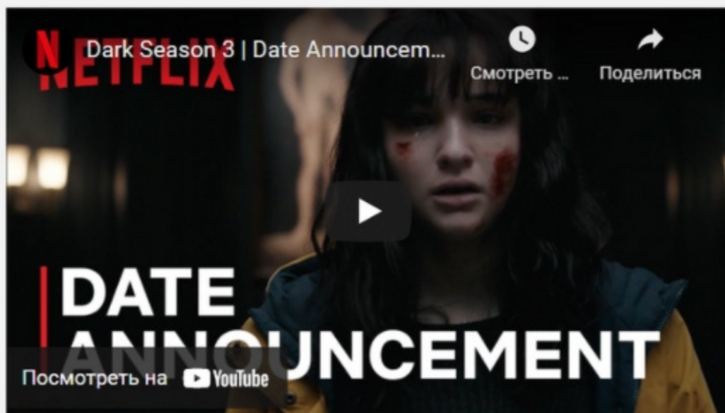
Трейлер сериала «Тьма»