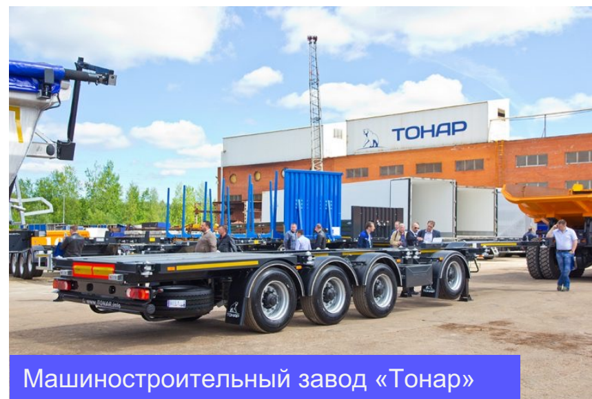
Машиностроительный завод «Тонар»