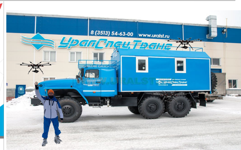
фото — прототип «Урал Дронпорт»